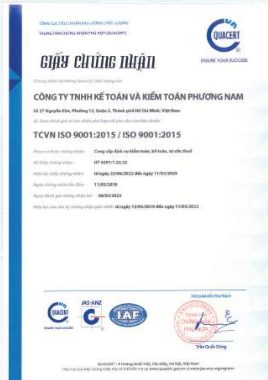
Giấy chứng nhận ISO 9001:2015